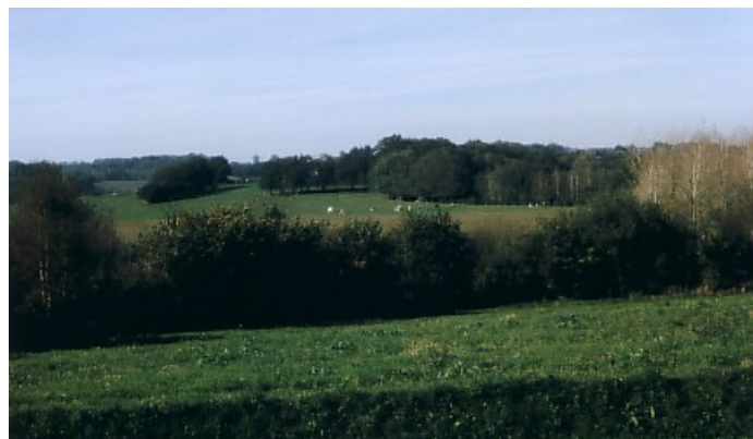
(Paysage de la région de Bignan)