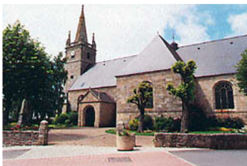
(Crac'h- l'église paroissiale)

En l'état, s'agissant de ce secteur, les recherches ont progressé moins systématiquement. Les conclusions restent donc très provisoires.