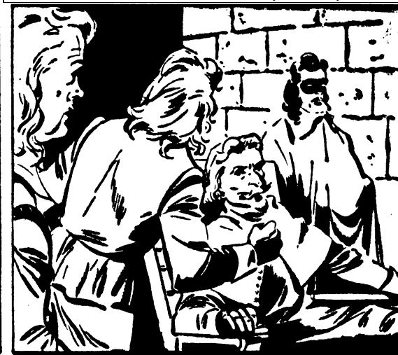
Richelieu demande à Marquis de parler

196. Après ces accusations du curé Marquis, Richelieu est blanc de rage. Ses yeux scintillent et d'une voix tremblante il crie: "Prêtre, prenez garde !" - "À quoi, Monseigneur ?" Demande Marquis. "Qu'est-ce que j'ai à craindre ? Je sais que la mort m'attend et que je ne lui échapperai pas. Les grands de ce monde accordent toujours une grâce à celui qui va mourir. Je vous réclame comme faveur suprême le droit de parler jusqu'au bout sans être interrompu. Je parlerai brièvement et je vous jure de ne rien dire qui ne soit vrai." "